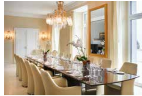
Champagne Private Dining