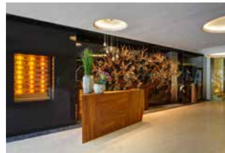
Wine Cellars Foyer