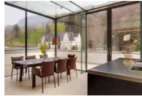
Old World Residence